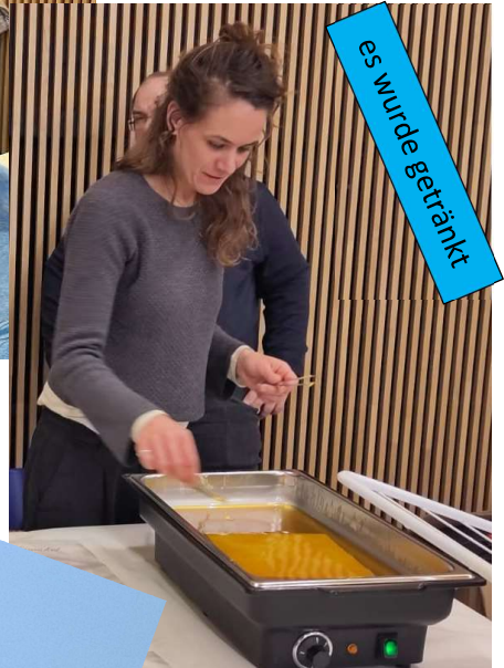
es wurde getränkt