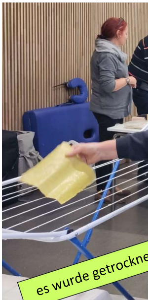
es wurde getrocknet