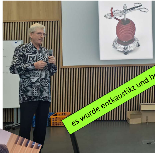
es wurde entkautst und bossiert