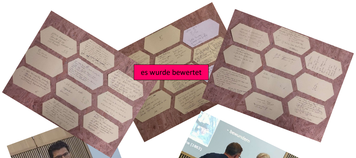
es wurde bewertet