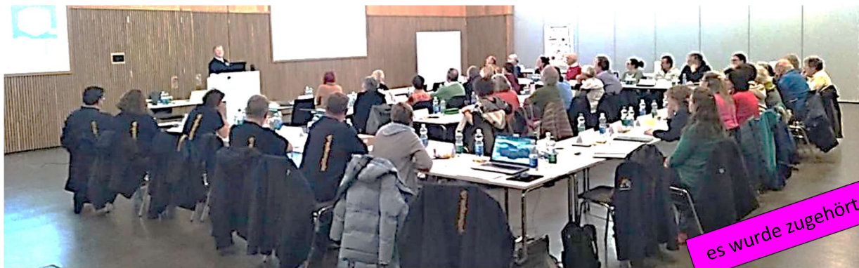
es wurde zugehört