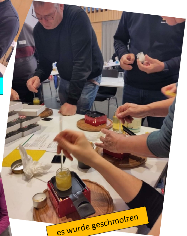
es wurde geschmolzen