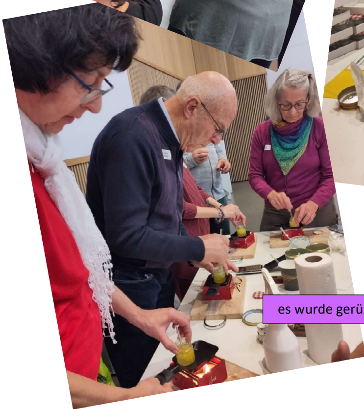
es wurde gerührt