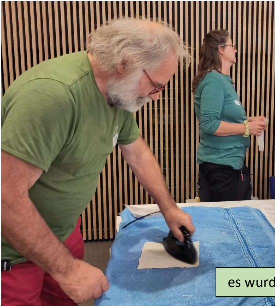
es wurde gebügelt