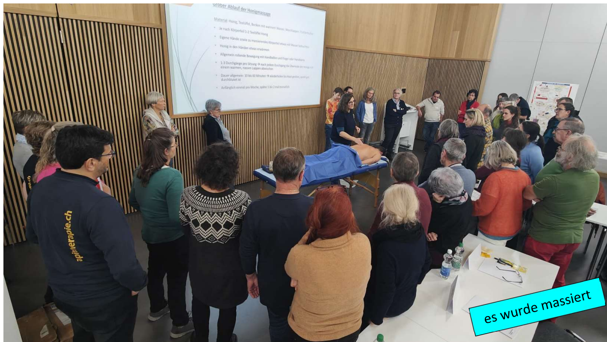
es wurde massiert

Körper-Ablauf der Honigmassage Mittel: Honig, Tschüpf, Backen mit warmem Wasser, Olivenöl, Lavendelöl Je nach Körpermaß 1,2 Tschüpf Honig Eigene Hände sowie zu massierenden Körperteil Honig mit Wasser abwaschen Honig in den Händen etwas anwärmeln Allgemein ruhende Bewegung mit Handballen und Finger über Hautfläche 1-3 Durchgänge je Seite → nach jedem Durchgang die Oberseite des Honigs mit einem sauberen, warmen Lappen abwaschen Dauer allgemein: 30 bis 45 Minuten → anschließend hat jeder sein ganzes durchblutet ist Außergleich einmal zum Waschen, wieder 1 bis 2 mal reinnehmen