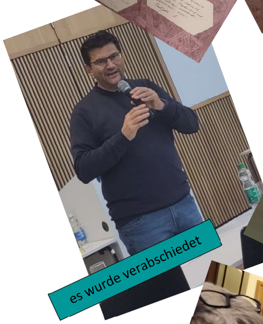
es wurde verabschiedet