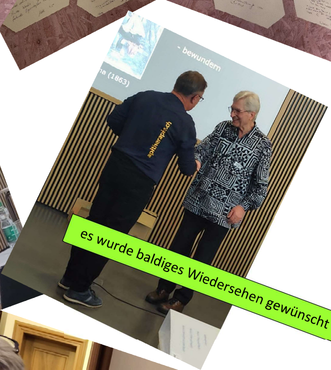
es wurde baldiges Wiedersehen gewünscht