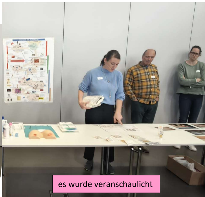
es wurde veranschaulicht