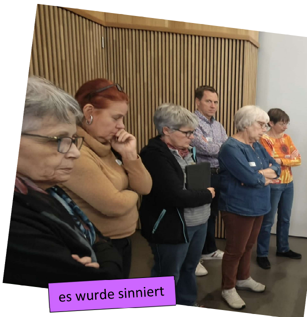
es wurde sinniert