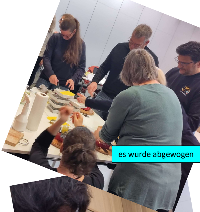
es wurde abgewogen