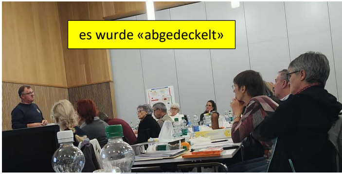
es wurde «abgedeckt»